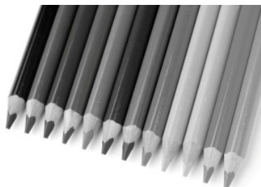
SW-Aufnahme ohne Filter