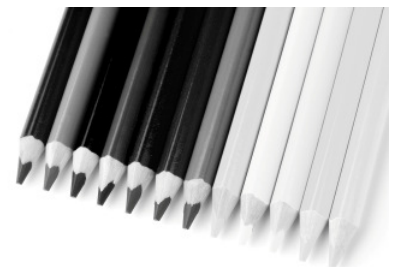
SW-Aufnahme mit B+W Rot dunkel Anteile der Eigenfarbe Rot werden heller, Anteile der Komplementärfarbe dunkler.

Jos. Schneider Optische Werke GmbH Ringstraße 132 55543 Bad Kreuznach Germany Phone +49 671 601-125 Fax +49 671 601-81 – 125 www.schneiderkreuznach.com/fotofilter filter@schneiderkreuznach.com